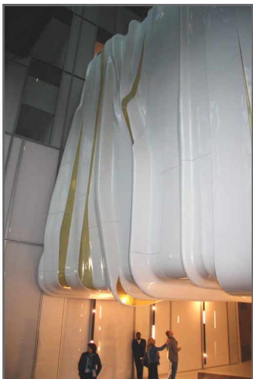
Voor het Mahler 4 project te Amsterdam werden 126 verschillende elementen uit Masterworks geproduceerd

Poly Products B.V. Bruningsstraat 10 4251 LA Werkendam Nederland