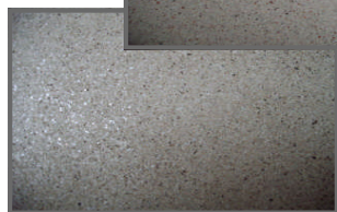
Steen-look met glitter