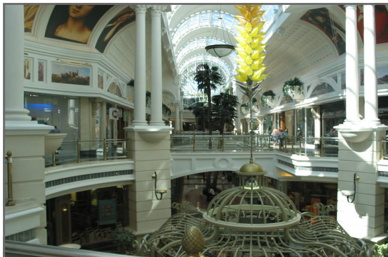
Kolommen en sierlijsten uit Masterworks te Zuid Afrika

Wij denken graag met u mee om uw maatwerk project te realiseren in onbrandbaar Masterworks. Of het nu gaat om repeterende elementen of vele unieke elementen, wij kunnen u met raad en daad bijstaan.