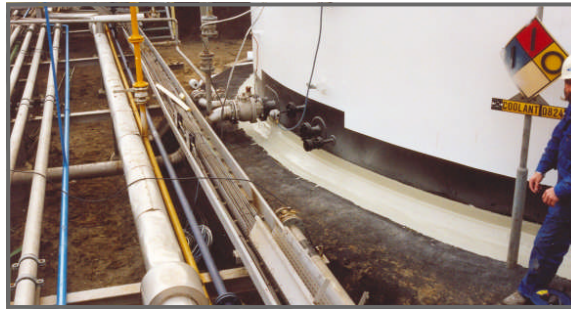
Tankterpen kunnen problemen met corrosie voorkomen, zeker als ze met Triflex gemaakt worden