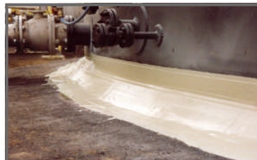
Afwerking met extra coating

Poly Products B.V. Bruningsstraat 10 4251 LA Werkendam Nederland