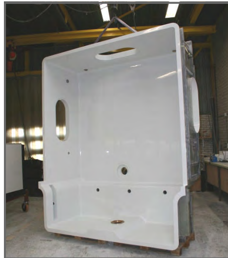
Diverse baden en whirlpools voor megajachten: allemaal enkelstuks!