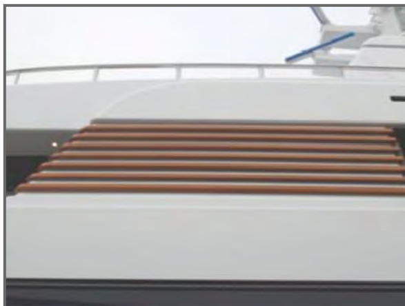
Bijzondere exterieurdelen: van carbon TV-wand tot ventilatieroosters.

Poly Products B.V. Bruningsstraat 10 4251 LA Werkendam Nederland